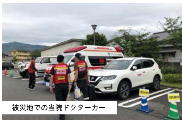
被災地での当院ドクターカー

6日午後から派遣期間中の業務調整をしながら災害支援に必要な点滴や薬剤、衛生用品、医療資機材に加え、土砂災害現場での活動に必要な長靴や雨合羽、再流行の兆しがあった新型コロナウイルス感染対策、活動期間中の食料や飲料水などの準備と、熊本地震でのDMAT派遣で重要性を痛感した患者搬送可能な緊急車両（ドクターカー）をフェリーで運ぶ調整などを半日かけて行いました。