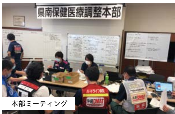
本部ミーティング

7日朝に空路と海路にチームを分け出動、熊本労災病院に設置された県南保健医療調整本部へ参集すると、当院DMATは本部内の避難所を支援する部門を任されることとなり、発災初日から活動していたDMATから業務を引き継ぎ、活動場所を変えながらも10日の夕方まで4日間、被災地の避難所の支援を行いました。