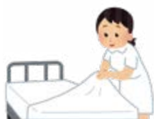
お部屋の清掃や環境整備 ベッドメイキングなど