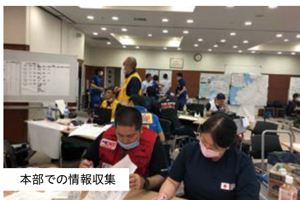
本部での情報収集

本部として、市町村をまたいで増えてくる避難所を把握、指定避難所だけでなく、孤立集落での避難場所や、プライバシーや防犯、三密を避けるなどの理由で自主避難された方たちの避難所、体調を壊される方が増えてくる傾向がある避難所や持病の薬が足りなくなる避難者を把握し、優先的に医療チームや保健師の介入を調整することが重要な活動でした。