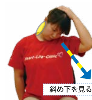
斜め下を見るように